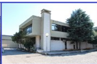
Scuola Secondaria di I grado "STEFANO DA PUTIGNANO"