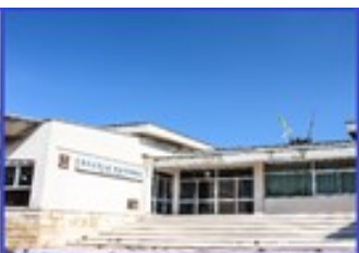
Scuola dell'Infanzia "SAN NICOLA" Attualmente ubicata presso il plesso "Di Mizio"