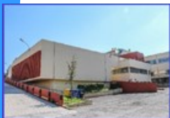
Scuola Primaria plesso "P. DI MIZIO" Via Eroi del Mare