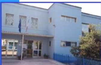
Scuola Primaria plesso "A. DE GASPERI"